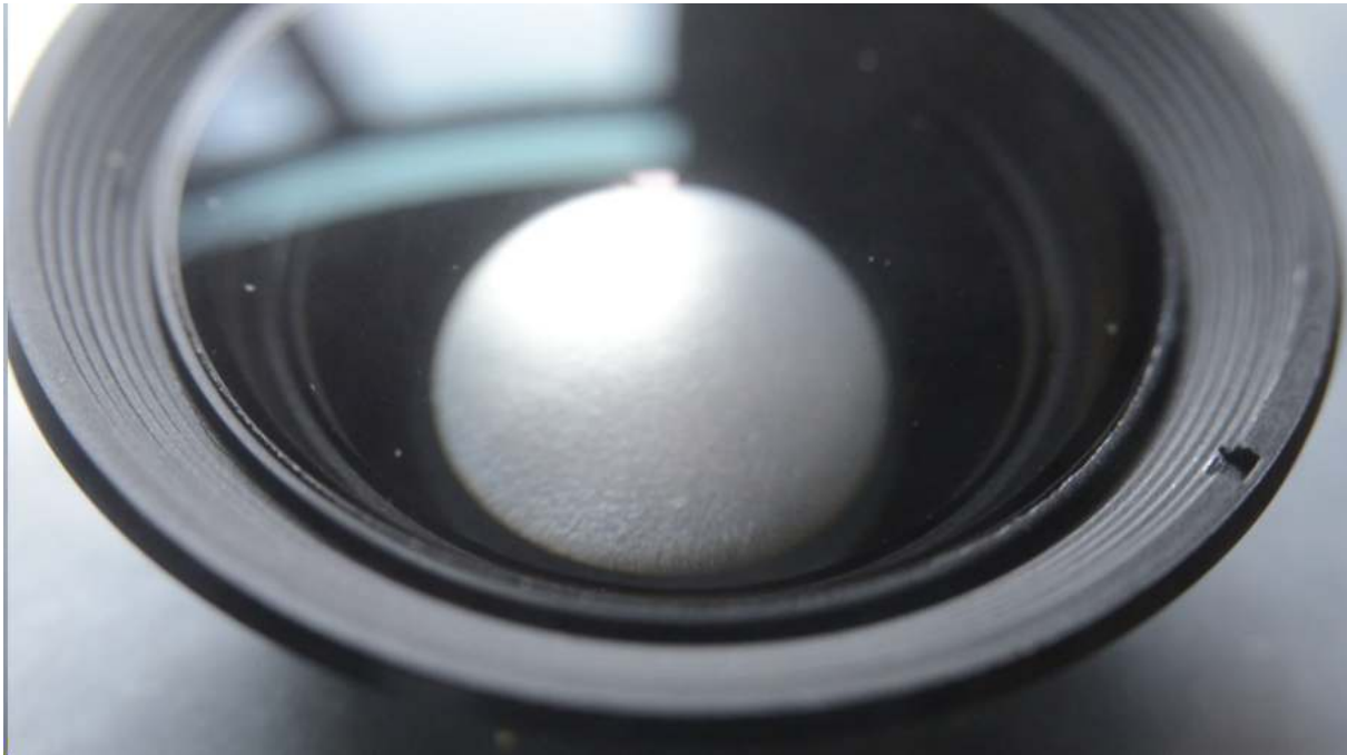
één van de twee openingen voor de wrench schroevendraaier is goed te zien.

Al lezende op het internet, ontdekte ik dat je met een kit-zoom best zelf een aardig macro objectief kunt maken. Nu worden de kit-zoom objectieven voor een kleine prijs meegeleverd met heel veel camera's. In 1979 begon Nikon met de plastic EM camera goedkopere E objectieven mee te leveren. Er was nog geen kit, maar de E objectieven hadden meer kunststof en waren dus goedkoper. Ten tijde van de F-50, F-60, zo van 1994 tot 1998, was een kit-objectief al bijna gewoon. Er zijn dus heel veel goedkope Nikon kit-zoom objectieven. Recent kwam ik een AF 28-80 f/3,3-5,6 G uit 2001 tegen. Gekocht voor 15 euro.