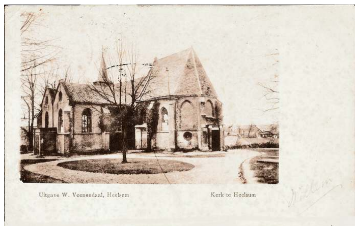
Op deze ansichtkaart zijn de 2 zadeldaken zichtbaar!