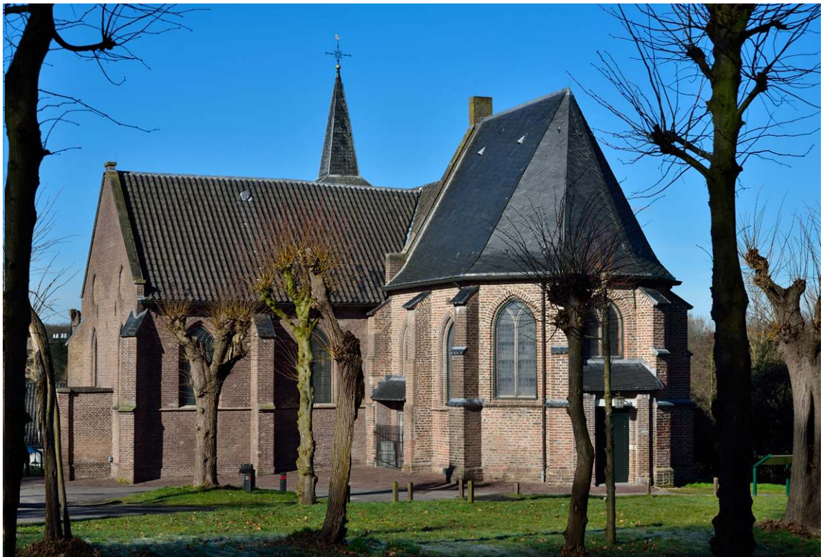
De kerk in 2016.