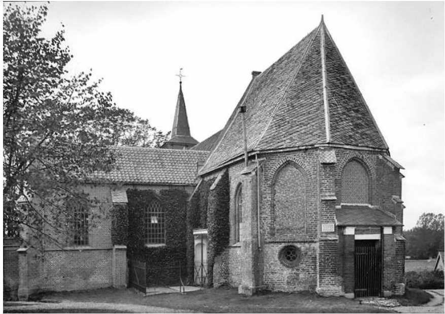
De afdekplaat van de grafkelder is nog zichtbaar