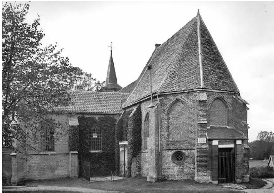
De afdekplaat van de grafkelder is nog zichtbaar