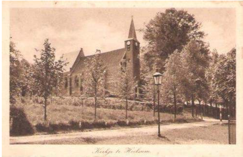
Kerkje te Heelsum oude ansichtkaart

Het kerkje op de heuvel ligt op een stuwwal naast de Heelsumsebeek. Bij hoog water op de Nederrijn zal de kerk droog blijven. Bij het hoogwater in 1995 overstroomde de beek. De brug over de Heelsumsebeek (Kerkweg) was voor fietsers en voetgangers begaanbaar doordat er een houten stelling gebruikt kon worden.