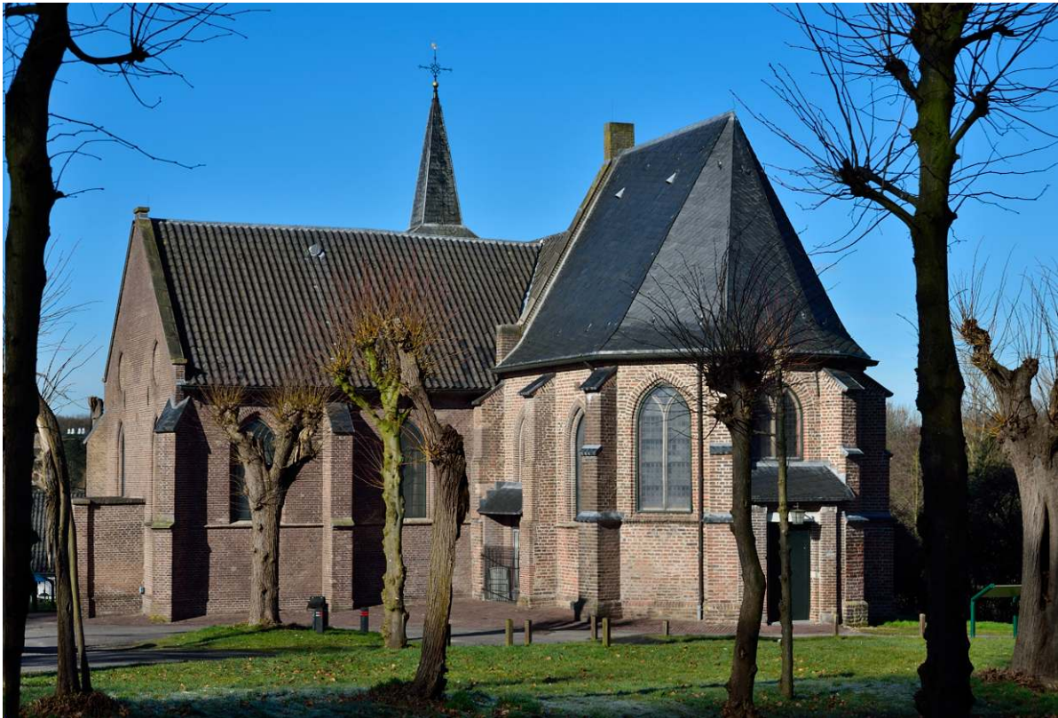
De kerk in 2016.