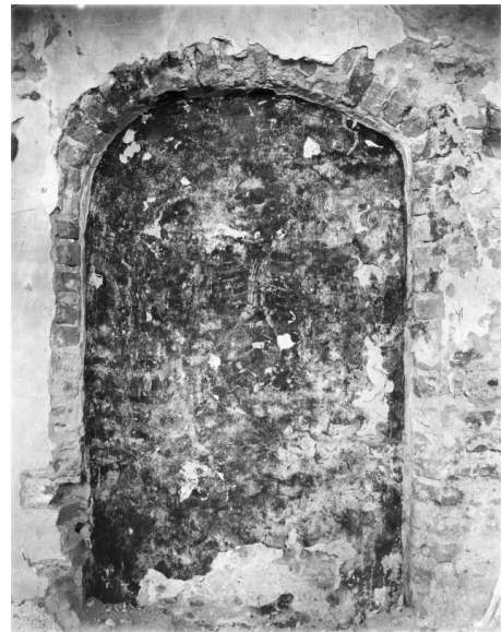
Een schildering gevonden in 1952.

Uit de verzameling van het Historisch Genootschap Redichem. In de tekst staat: Eind 40-er jaren. Herv. Kerkje van Heelsum (toen nog met aangebouwd "lijkenhuisje"). Denk dat het jaartal niet klopt. Eind jaren 40 is het dak wel door Vereniging de Keyser hersteld, maar de muren en ramen komen eerst na 1951 aan de buurt.