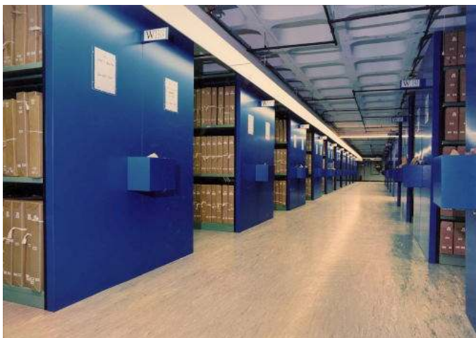
Waar te beginnen?